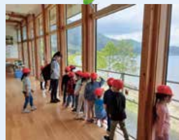
田沢湖の美しさにだしのこ園の園児たちも興奮気味！

昨年の 9 月と 12 月には山梨県から新たなクニマスの貸与があり、現在、大水槽には満 4 歳のクニマスが 4 尾、中水槽には満 2 歳魚 3 尾、小水槽には満 1 歳魚 4 尾を飼育・展示しています。ぜひご来館のうえ、1 歳魚・2 歳魚・4 歳魚のクニマスの成長過程を見比べてください。なお、市民の皆さまと障がい者手帳などをお持ちの方の入館は無料です。