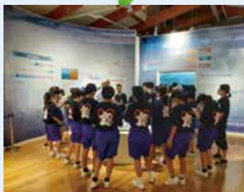
熱心に説明を聞く、角館中学校の生徒の皆さん。

これまで田沢湖クニマス未来館には延べ 85,000 人（令和 4 年 3 月末）のお客さまに来館をいただいております。学校や子ども関係の団体が年々増加傾向にあります。近年は新型コロナウイルス感染拡大の影響などもありましたが、今年のゴールデンウィーク期間は昨年の 1.5 倍の来館者数となり、県外の中学校の修学旅行などの団体予約も増加していることから、今年度末頃には来館者 10 万人の記念セレモニーの開催を予定しています。