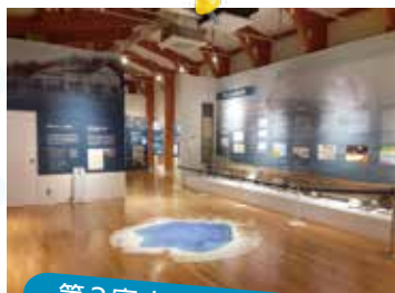
第 2 室 かつての田沢湖