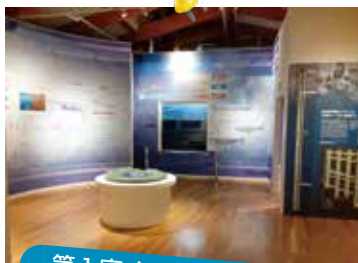
第 1 室 クニマス大水槽