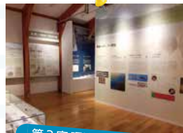
第 3 室 環境再生への道