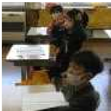
台本も少しずつ覚えていきます