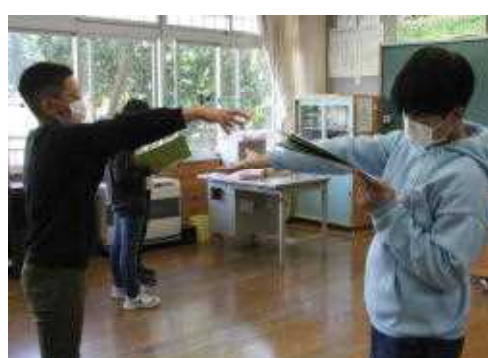
英語劇に挑戦します！