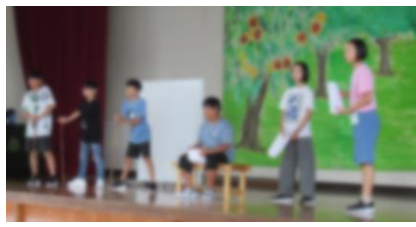
明日にでも本番ができそう！？順調に練習が進む6年生！