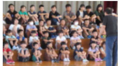
「もっと上手に歌うにはね・・・」先生の指導に熱心に耳を傾ける子どもたち

昨日の朝のスキルタイムは2回目の全校音楽練習でした。前回の練習（整列の仕方や位置の確認）を生かして入場し、仙北市民歌を一度歌ってみました。一人一人の真剣な表情が印象的で、くりっこフェスタ成功をめざしてがんばろうとする気持ちがよくわかりました。各学年でも、体育館ステージを使った練習に熱が入ってきました。あまりお伝えすると楽しさが無くなってしまいますので、練習の様子をちょこっとお伝えします。