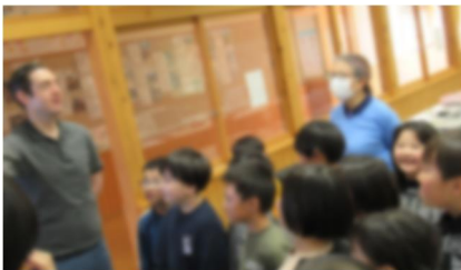
3年生が初めての「外国語活動」