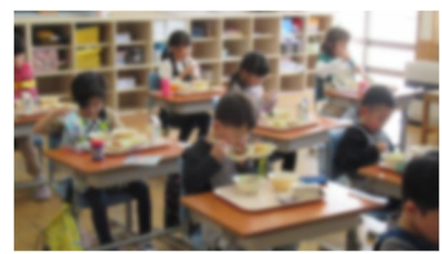
初めての「給食いただきます」