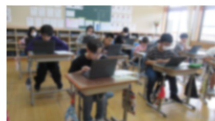
クロームブックでオンライン回答