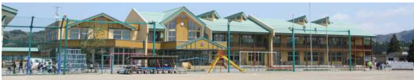
平成16年新築の校舎（現在の校舎）