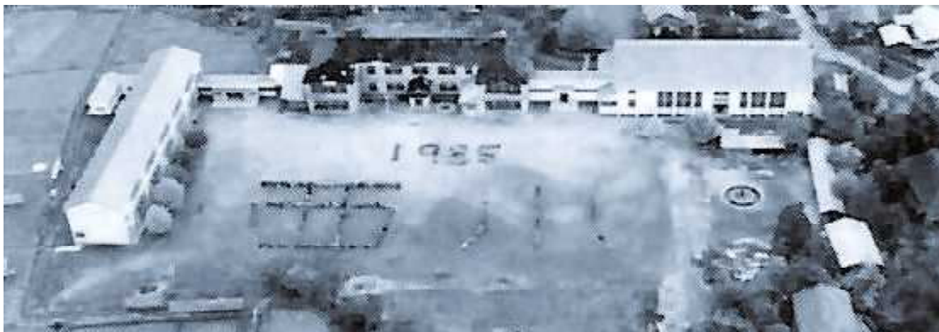
昭和40年当時の校舎