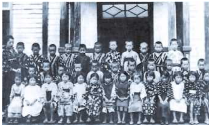
大正時代の西明寺小児童