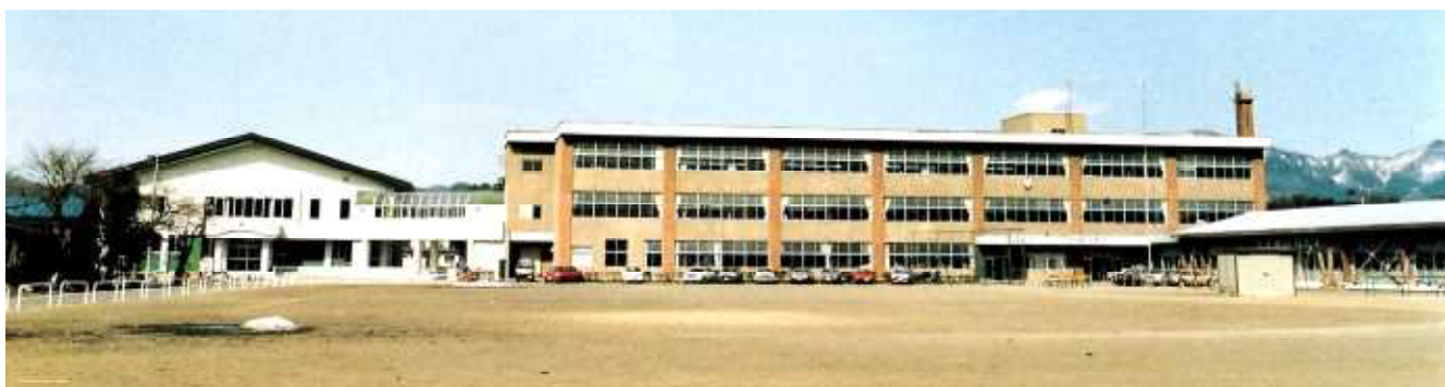
昭和46年新築の校舎（左側の体育館は現在もある体育館）