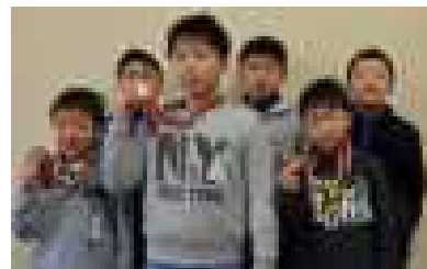
大会に出場した本校少年剣士