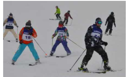
きれいなシュプールを描く6年生

1月17日(木)6年生のスキー学習を皮切りに今年度のスキー学習が始まりました。17日は、時折強い風が吹き、かなり寒かったのですが、市内のスキー連盟の方や保護者の方々の御指導をいただきながらスキーの技術を高めました。私も子どもたちの滑りを見せてもらいましたが、さすが県内一のスキー場で練習しているだけあって、レベルの高さを感じました。これから、各学年スキー学習・スキー教室が行われますが、恵まれた環境を生かしスキーの技能をどんどん高めてほしいと思っています。保護者の方々には、スキー指導や用具の運搬等で御難儀をおかけします。どうかよろしくお願いたします。