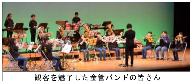
観客を魅了した金管バンドの皆さん

1月19日（土）仙北市民会館で、金管バンドのラストコンサートが開催されました。会場には、たくさんの方が詰めかけ、私も開演の少し前に着いたのですが、プログラムをもらうことができないほどでした。コンサートは3部に分かれており、第1部では、「アンパンマンのマーチ」や星野源の「アイデア」などテレビでよく耳にする曲が、第2部では、生保内中学校の吹奏楽部員やたざわこ吹奏楽団の皆さんとともにジャズの定番「sing sing sing」や中島みゆきの「糸」、横浜銀蠅の「男の勲章」などを、そして第3部では、マーチング大会で披露した「明日があるさ」や「上を向いて歩こう」などが演奏されました。合間に抽選会やクイズなどもあり、子どもからお年寄りまで楽しめるコンサートでした。全部で10曲以上演奏したのですが、マーチングの東北大会が終わってからの短い期間でよく仕上げたと思うほどのきれいな演奏で、演奏が終わる度にたくさんの拍手をいただきました。6年生は今回のコンサートで引退になります。5年生以下の部員が、伝統を引き継いで頑張りたいと思います。