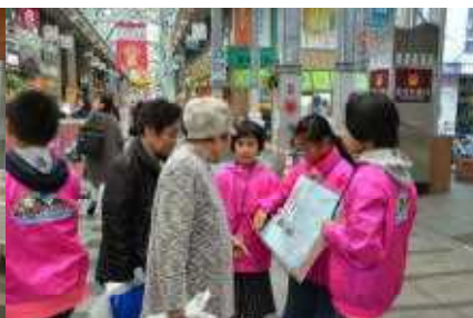
仙北市をPRする愛さん、 M.さん、A.さん