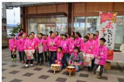
生保内節を大きな声で歌う 4年生の皆さん

11月9日(金)4年生が、盛岡市の肴町商店街で仙北市をPRしてきました。前号でも紹介しましたが、4年生は総合的な学習の時間、仙北市のよさを学習し、仙北市に来てもらうためのPR活動に取り組んでいます。今回は、生保内地域運営隊の方々のご協力を得て、盛岡市にある肴町商店街で、生保内節を歌ったり、仙北市をPRするチラシを配ったりしながら、あんべいいなチャーハン、ベリーなクッキーを販売してきました。子どもたちは、通りかかった方々に大きな声で宣伝し、準備したチャーハンとクッキーを1時間ほどで完売することができました。収益金は、東日本大震災で被災した岩手県山田町の小学校にこの後届ける予定です。午後からは、復興支援道路である宮古盛岡横断道路の与部沢トンネル工事現場に行き、トンネル工事について学んだ後、工事現場を見学しました。担当者の説明を聞いた後、鋭い質問をする4年生に驚きました。