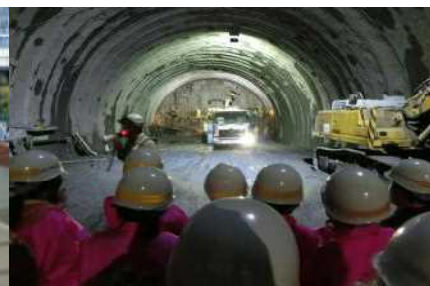
ヘルメット、マスクを着用して、 トンネル工事現場を見学