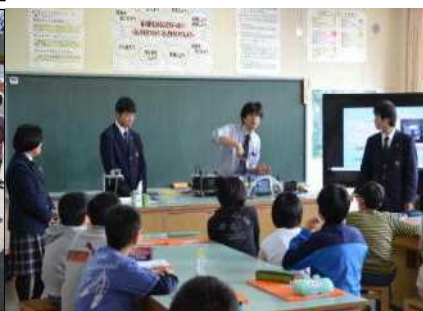
大曲農業高校生物科学部から酸性水の中和について学んだ5年生