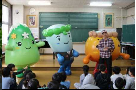
オモテナシ3兄弟から田沢湖地区の調査依頼を受けた3年生