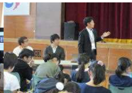
仙北市役所の職員の方々から「特区」について学んだ6年生