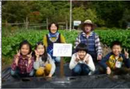
地域の方から野菜作りについて学んだ2年生