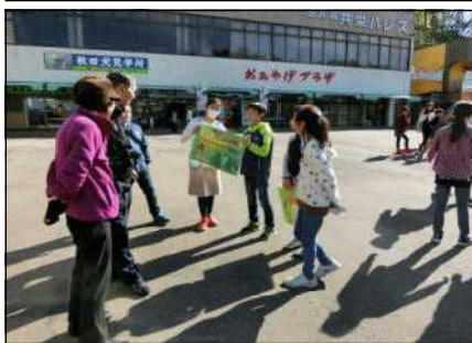
田沢湖畔で観光客に仙北市の見どころをPRした4年生