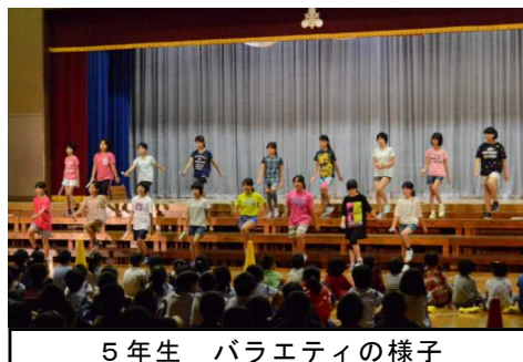
5年生 バラエティの様子