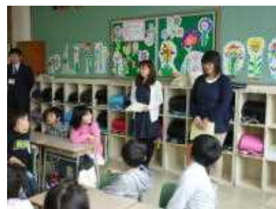
1年生を温かく見守る先生方

4月16日(月)、17日(火)の2日間にわたって、だしのこ園の6名の先生方が1年生の様子を見に来てくれました。だしのこ園の先生方からは、「みんな伸び伸びと過ごしている」「授業時間が長いので心配しましたが、きちんと座って話を聞いている子が多かった」などの感想をいただきました。これからは時々、子どもたちの成長を見に来てほしいと思います。