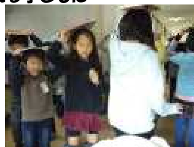
教科書で頭を守って避難

4月12日(木)災害発生時の初期対応と避難経路の確認を兼ねて、シェイクアウト訓練を実施しました。緊急事態発生時の放送とともに机の下に身を隠し、先生方の指示で避難経路を確認しました。緊張感をもって行うことができました。今年に入ってから島根県での地震や大分県での土砂災害など自然災害が起きています。いづどこにいても自分の命を自分で守れる子どもになってほしいと願っています。