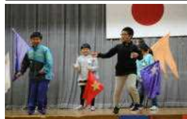
ダンスクラブのプレゼン

4月11日(水)4・5年生の児童が所属するクラブを決めるクラブプレゼンテーションを行いました。6年生は、4・5年生の希望者がいないと自分たちのクラブがなくなってしまうため、必死に楽しさをアピールしていました。4・5年生はそれを見て自分で入りたいクラブを選びました。お子さんがどんなクラブに入ったのか、ご家庭で話題にしてみてください。