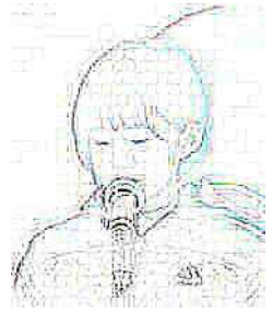
元氣アップムービーを撮影して