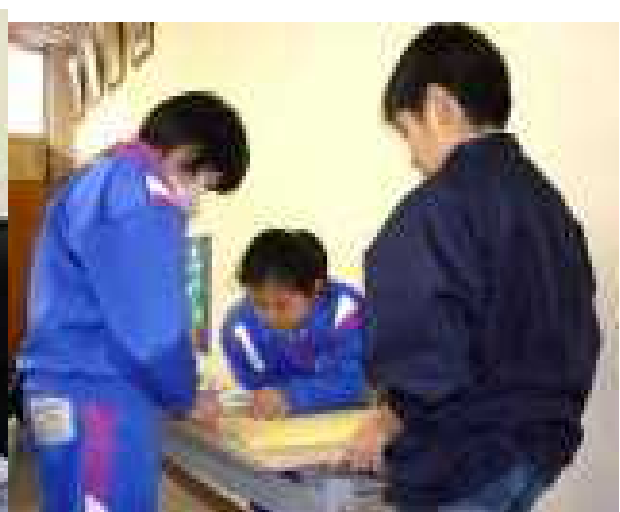
《メッセージカードを切るメンバー》