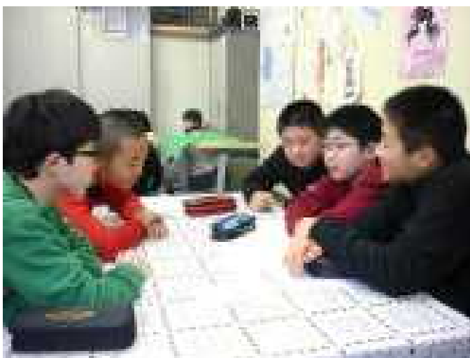
《どんな新聞にするか話し合うメンバー》