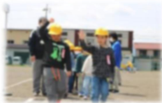
1年生の「信号機」を使った歩行訓練

晴天のもと、地域や保護者の方々、仙北警察署の方々の協力をいただき、実際に歩いたり自転車に乗ったりしながら交通ルールについて学びました。開会式の6年代表の話ではC. Kさんが、「自分の命を守るために、真剣に参加したい」と決意を述べました。