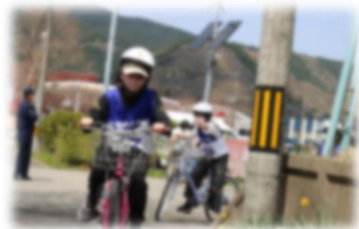
路上での自転車訓練