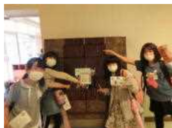
伝承館では、榊細工も見学しました