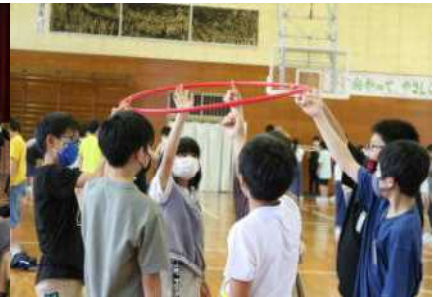
あっという間に仲良くなれた交流ゲーム