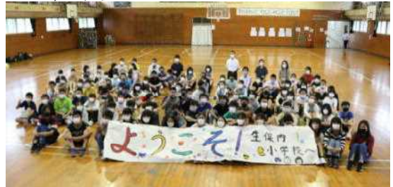
お別れの前にみんなで記念写真を撮りました

プログラムにあるように、はじめにお互いの学校や地域のことについて、パワーポイントを使って紹介し合いました。生保内小学校からは、クニマス・潟分校・駒ヶ岳・スキー場・温泉・田沢湖などについて紹介しました。東小学校からは、全校児童が490人いること、毎年東小学校の中庭にカルガモがやってくる、学校の近くにあるスターバックスや人気のパン屋さんなどについて紹介がありました。その後、グループに分かれて交流ゲームをし、会を終えました。生保内小学校6年生から、交流の記念としてプラスチック製の板を熱で縮めて作った手作りキーホルダーをプレゼントしました。