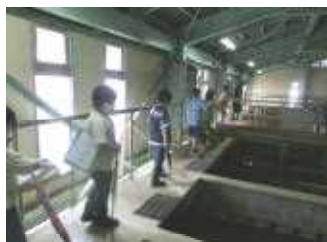
浄水場の沈殿池の様子段階的に汚れが落ちていきます