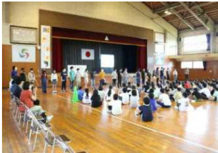
初めて顔を合わせ緊張気味の子どもたち

はじめは少し緊張気味の子どもたちでしたが、交流ゲームを通してあっという間に心が打ち解けた様子でした。他校との交流は様々な刺激があり、大変有意義なものであると感じた時間となりました。