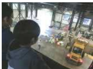
粗大ゴミが粉碎機に投入される様子を見学

最後に一億円分の紙幣の重さを体験できる模擬紙幣が登場し、とても盛り上がりました。税金について考える貴重な時間となりました。