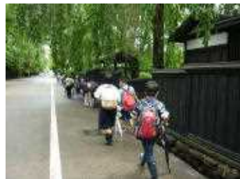
武家屋敷通りも、歩きながら様子を見学しました

ながら、チャーハン販売する活動をしてきます。コロナ禍のため昨年度は実施できませんでした。今年度は11月上旬に行う予定です。