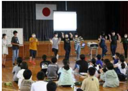
生保内小オリジナル「あんべいいな」の歌