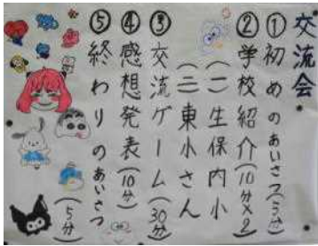
迎える側の本校6年生が準備を進めました