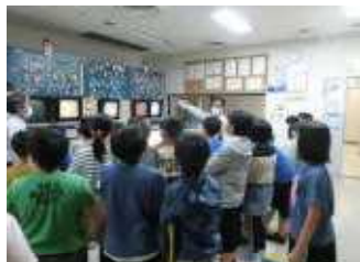
集中管理室で、焼炉の様子を確認している様子を見学