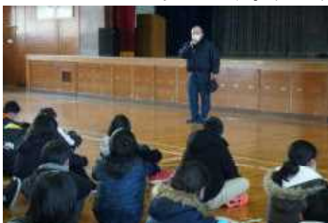
消防署の方から、避難するとき大切なこととお話してもらいました

また、学校に設置している防火扉も作動させ、そこを通る訓練もしました。火災が起きると自動的に閉まる大きな鉄の扉の中にある小さな扉を開けて、10cmほど高くなっていく段差を上手にまたいで通過する体験をすることで、非常時に気を付けることを学習しました。小さな扉は場所によっては「押す」「引く」が違う扉ですので、その違いも確認できました。