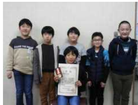
大会に出場した皆さん 中央が優秀選手賞受賞のK.Fさん