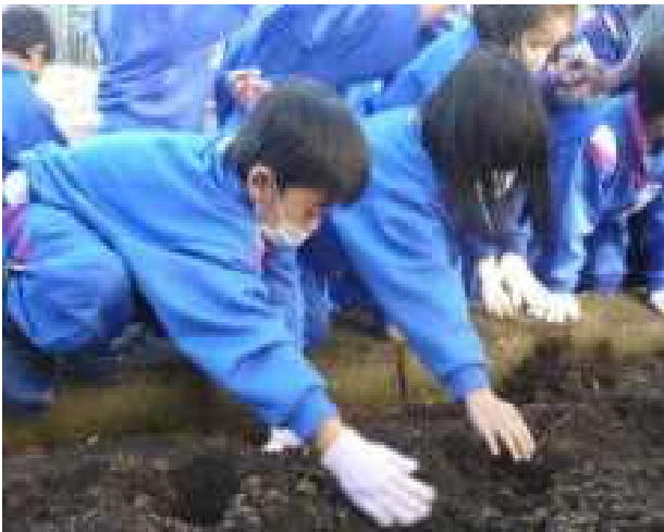
心を込めて球根を植えました

11月30日に、児童玄関横の花壇にチューリップの球根を植えました。本校では毎年、来春入学して1・2年生がチューリップの球根を植えています。球根の芽が上にならぬように、前もって開けていくた穴にポトンと落とし、その上に優しく土をかけ、植え付けを完了しました。1年生と2年生が150球ほどのチューリップを植えました。来年度の4月には、新入生を迎えてくれる予定です。