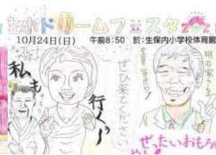
おもしろいで賞 4年 C.Kさん