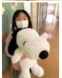
入退場も立派にできました

今後も、学校での行事におきましては、保護者の皆様方にご協力をお願いしながら実施して参りますので、よろしく願います。