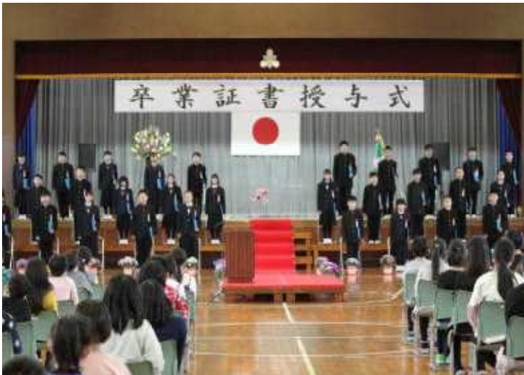
卒業証書を受け取った卒業生 みんなとても立派でした