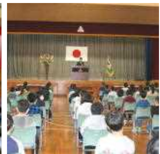
全校児童が立派に 参加しました