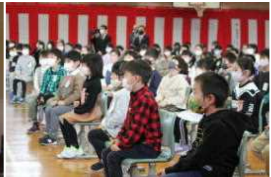
在校生も立派な態度で 卒業をお祝いました