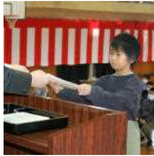
2年 代表 S.Sさん