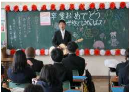
最後の教室で担任のK先生が 「栄光の架け橋」を熱唱!