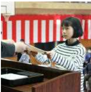
4年 代表 T.Mさん