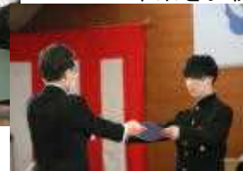
証書をもらう姿が 凛々しいです