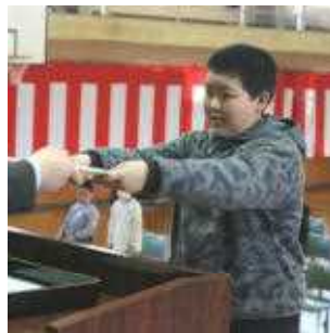
5年 代表 T.Eさん