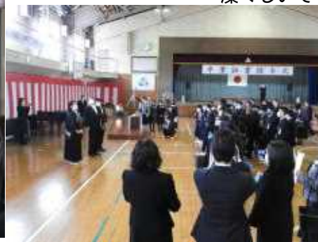
6年生の保護者のみなさんによる 感謝の会