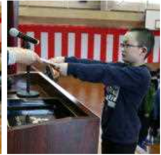
3年 代表 T.Sさん