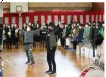
5年生による 力強いエール