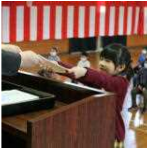
1年 代表 T.Sさん