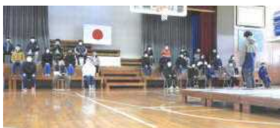
6年生の練習の様子

今年度は、アルコール消毒、マスク着用（歌はマスク着用のままで）、検温、十分な間隔、可能な限り短縮できる内容、学級活動はリモートで、などコロナウイルス感染症予防対策ガイドラインに則り、実施します。