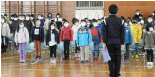
歌うときの姿勢を確かめました