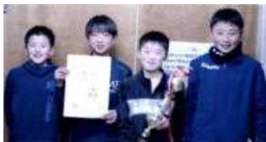
本校メンバー (写真 左から) S.Yさん S.Yさん O.Hさん C.Tさん (全員6年生)

F C角館セレジェスタ 2月21日(日)大仙市民体育館 2020年度 県南フットサル大会U12 <予選リーグ> 角館4-0大曲A 角館2-1湯沢 <決勝・順位トーナメント> 角館1-1西仙北A PK 5-4 【決勝】角館1-0十文字