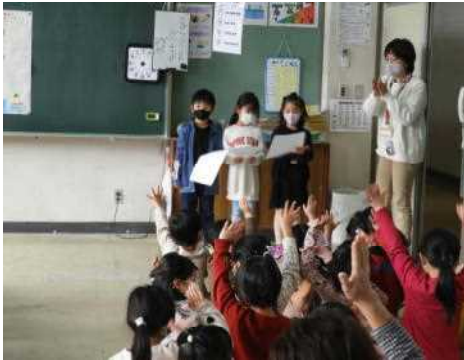
1年生は会の進行も がんばりました

年長さんと呼び込みました。たっぷりと遊んでもらった後、年長さんに感想を言ってもらったところ、「楽しかった」と大喜びしている様子に、1年生もにこにこしていました。だしのこ園の先生方も、1年生の成長ぶりに感心していたようでした。