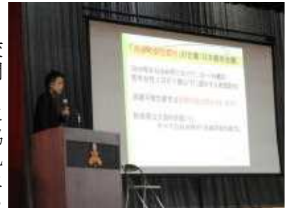
S副会長さんの講演

また、今回の講演会は新型コロナウイルス感染症予防の観点から、S副会長さんをお願いをし、「家庭でできる立志教育～子どもたちの生き抜く力を支援～」と題して講演していただきました。現在の社会の状況について一通りお話をしていただいた上で、「10歳は人生経営の就任式」「何があってもぶれない志」「内なる心に火をつける」というキーワードを交えながら、誰しもができる簡単な家庭のルール(幸せ家訓カード)づくりについて提案されました。また、結果を褒めることから、努力・その過程・全力で向かう姿勢等を褒めることへと変えていく点を力説してくださいました。S副会長さんにはお忙しいところ講演してくださいましたことに感謝申し上げます。