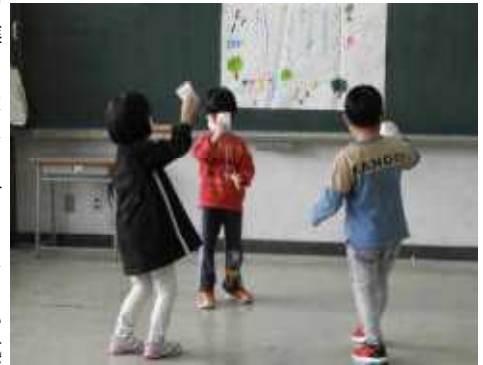
けん玉を楽しむ年長さん

1月30日(月)に、1年生が秋の自然物などを使って作ったおもちゃなどを、年長さんに喜んで遊んでもらう会として『げんきフェス』を行いました。1年生は生活科の時間に①さかなつり、②プレゼント、③ようふくや、④コップゲーム、⑤がっき、⑥けんだま&どんぐりごま、⑦まとあて、⑧おめん、⑨はっぱプールなど、年長さんが喜んで遊んでくれそうなお店を開けるよう、準備を進めてきました。はじめの会を行った後に、それぞれの担当に分かれて「いらっしや〜い」「たのしいですよ!」などと声をかけ、