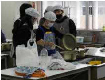
理科室や家庭科室で6年生が調理

食べ終わってから、校内全部を使ってのオリエンテーリングをしました。校内に7つの問題を準備し、それをグループで見つけて問題を解いていくものです。全部解き終わると「あきのおまつり」という言葉が作れると成功です。全ての縦割りグループが課題をクリアすることができました。