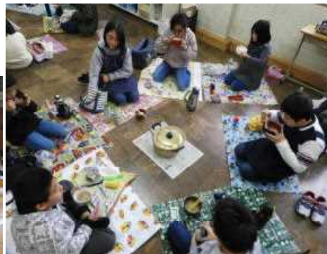
できあがった鍋は縦割りグループでおいしく食べました