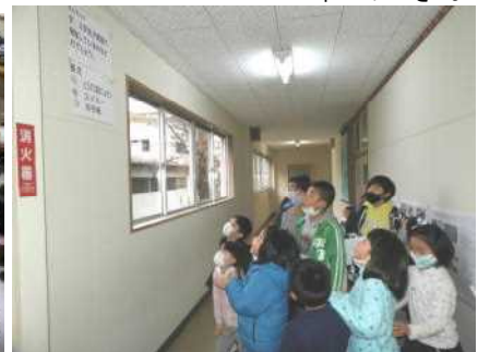
オリエンテーリングの様子