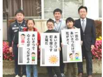
できあがったあいさつ看板を持って記念撮影