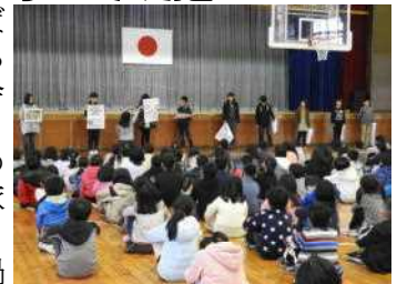
健康委員会からなべっこの説明をしてスタート！

11月4日(水)は非常に寒くなった日でした。例年であれば10月に行っているなべっこでしたが、今年は約1ヶ月ほど後ろにずらしての行事となってしまいました。そのため、今年は校舎の中で鍋を作ることになりました。6年生が中心となって各縦割りグループの鍋を作り、お昼頃に各班に分かれて体育館や各学年の学習室等を使って食べました。今年のなべっこのメニューは、豚肉か鶏肉か、味噌味か醤油味かという選択だけで作りました。6年生は手慣れた手つきで作業を進め、あっという間においしい鍋を作ってくれました。食べてみると、どの班の鍋もとてもおいしくできているようで、ほとんどの子どもが「おいしい！」と言いながら、2～3杯くらいおかわりをして食べていたようです。そして、各グループの鍋は空っぽになっていました。