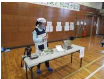
体育館でも作りました