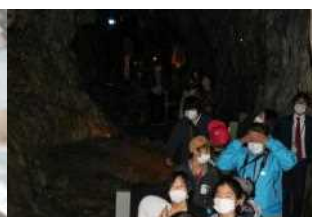
龍泉洞の中は ひんやり