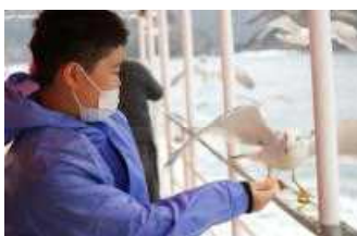
カモメにエサをあげたい でも少しドキドキ