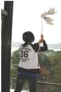
2日目の朝は雨 晴れるお祈り?