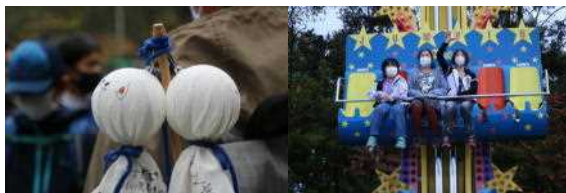
5年生からもらった てるてる坊主 晴れて!