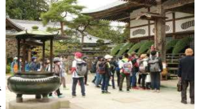
中尊寺本堂にお参り

旅行期間中はみんな元気で過ごせましたし、約束や時間もきちんと守った行動ができました。今回の修学旅行は班別の研修などはなく、全員で同じく行動する旅行となりましたが、そんな中でも岩手県の自然や文化、歴史に触れ、また震災についても学ぶ事ができた有意義な2日間になったと思います。6年生は、修学旅行に行けることに感謝の気持ちをもって今回の旅行に臨みました。旅行での様々な経験が、今後の勉強や生活に生かされることを願っています。