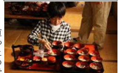
盛り出し式平泉わんこそばを堪能24杯分食べました(おかわりも可)