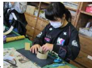
ダンボール同士を 付けたり強くしたり…

5年生が制作した作品は、現在図工室に展示していますが、PTA参観日にも保護者の方々に見ていただく予定です。