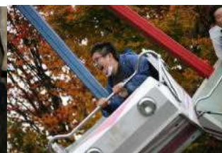
遊園地では 心の底から楽しみました