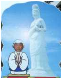
何をお祈りしたのでしょ

10月22日(木)・23日(金)に6年生は修学旅行に行ってきました。年度当初は5月に行く予定でしたがコロナ禍により10月まで延期となり、まさに待ちに待った修学旅行となりました。「おひさま学年」ですので、快晴の修学旅行を期待しましたが、残念ながら曇りや小雨の天候となってしまいました。