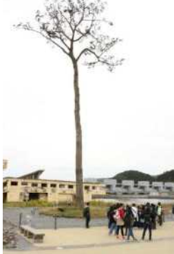
奇跡の一本松 津波の怖さを感じました