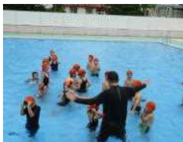
「ねことねずみ」 で、プールの中 で追いかけっこ を楽しむ1年 生

7月6日（木）に、1年生が初めて小学校のプールに入りました。この日は気温26度、水温24度と、久しぶりに絶好のプール日和でした。プールに入るとうれしくて歓声が止まりません。水をパシャパシャさせながら、楽しそうにあっちこっちに動き回っていました。教頭先生が「ねことねずみ」という簡単な鬼ごっこのようなゲームをして、水に慣れさせようとしています。どの子も怖がることなく、楽しみながら、水に親しんでいます。