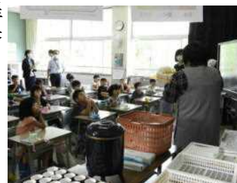
「虫歯ゼロさくせん」で染め出し体験や養護教諭の話聞く2年生

7月3日(金)5校時に、仙北市教育委員会による学校訪問があり、全校の授業の様子を見ていただきました。この日訪問してくださったのは、教育長さんをはじめとする4名の教育委員と仙北市教育委員会の4名、計9名の方々です。40分程度しか時間がない中、全ての学級をまわっていただきました。参観後、教育委員を代表して次のようなご意見をいただきました。