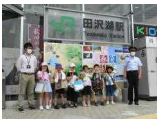
田沢湖駅では見 学が終わって みんなで記念 写真