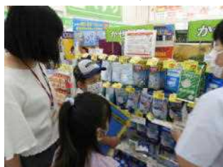
マスクのことに ついて質問をする N.K.さん

見学を終えた後、たくさんのお土産もいただいてきました。2年生は、自分で調べてみたい場所に行き、たくさんのお話を聞いたり、経験させてもらったりして大満足の様子でした。