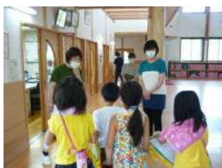
なつかしい「 だしのこ園」 の先生たちに ご挨拶