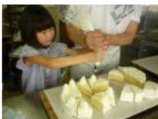
まさき菓子店 で、S.M.さん がケーキ作り を体験