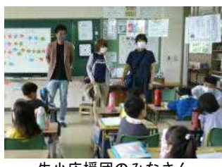
生小応援団の みなさん「よ ろしくお願い します」