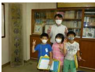
生保内中学校校 長室で校長先 生と一緒にパ シャ！