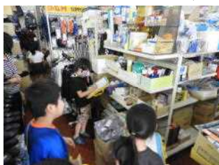
田ロスポーツさんの中 にあるたくさん の商品に驚く 2年生