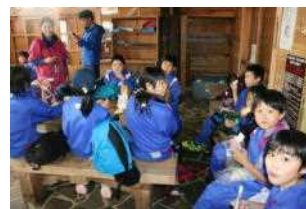
早めに山を下りて 8合目でお弁当を食べたよ