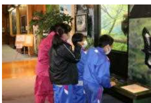
アルパこまくさで 防災ステーションなどを見学