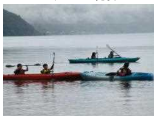
楽しみにしていたカヌー あっという間に上達しました