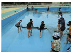
気持ちをそろえて汚れた水を排水する5年生