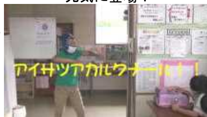
②「アイサツアカルクナル」と唱えたら...