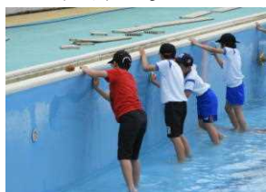
壁の汚れを丁寧に落とす6年生

ムービーでは、最後に、あいさつ標語のお願いもしました。全校児童にあいさつがよくなる標語を考えてもらいます。みんなの分がそろったら、校内に掲示していきます。来校の際には是非ご覧になって下さい。