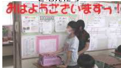
③とっても元気な明るいあいさつができました