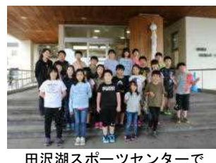
田沢湖スポーツセンターで 活動成功の記念写真