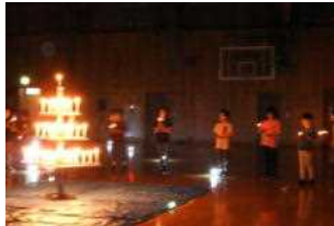
外でのキャンプファイヤーを 変更して体育館でトーチサービス