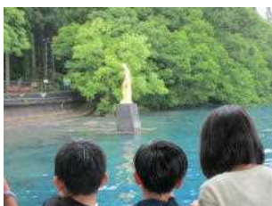
後ろ側から「たつこ像」を 見ました！