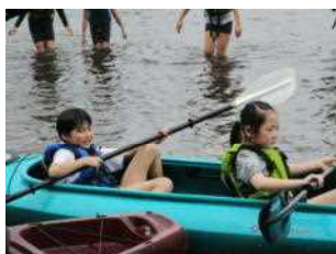
約1時間半のカヌー体験 疲れて戻ってきました