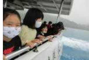
2日目の活動は 遊覧船乗船からスタート