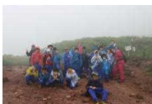
途中の展望台で 記念写真