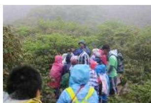
苦しさに負けないぞ！ 最後まで登山をがんばりました