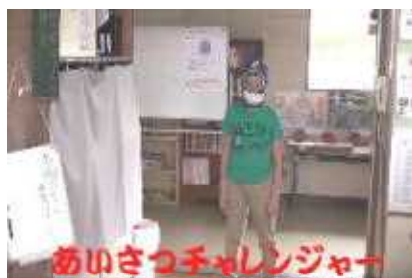
①あいさつチャレンジャーが元気に登場!

「こまくさNo.7」でも紹介しましたが、今年度の生保内小学校児童会テーマは『全校みんながチャレンジャー ~みんながやさしく助け合う生保内小学校~』です。例年、全校集会を開いて、運営委員会が児童会テーマをPRしていました。しかし、今年度はコロナウイルス感染予防の観点から、全校児童が集まる機会を減らして対応しています。テーマが決まったものの、これまで全校児童にアピールする機会がありませんでしたが、今回、各学級で見られるようにと運営委員会の皆さんが”ムービー”を作成し、それぞれの学級で見てもらいました。あいさつや読書がんばろうというメッセージが込められた”ムービー”です。これを見た全校の皆さんは、自分から進んで取り組んでいこうとする気持ちが湧いてきたようです。これからも、生保内小学校児童のチャレンジに注目して下さい。