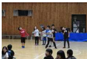
お楽しみ スタuntsの発表