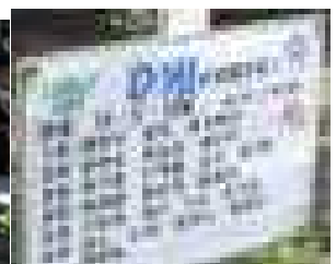
縦割りグループで お世話をがんばります