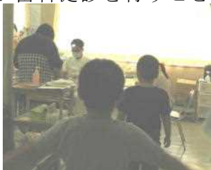
静かに順番を待ち先生に看てもらいました

今年度は、心電図検査、貧血検査、尿検査などの検査は実施しておりますが、学校医が来校しての健診は実施が延びておりました。6月16日（火）には1・6年生、17日（水）には2・5年生が歯科健診を行うことができました。今年度から、学校歯科医の先生に代わり、「がんばって磨いていますが、磨き残しが見られません」と話して下さいました。