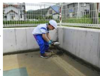
すみっこにたまった落ち葉を丁寧に集めるT.Sさん

1年生はプールサイド周囲の側溝、2年生は小プールオーバーフローのよごれ、3年生は大プールオーバーフローの汚れとプールサイドをきれいに掃除しました。来週から再来週にかけて4年生が更衣室・トイレ、シャワー付近、5・6年生は大小プールの壁面と底を掃除をしていく予定です。