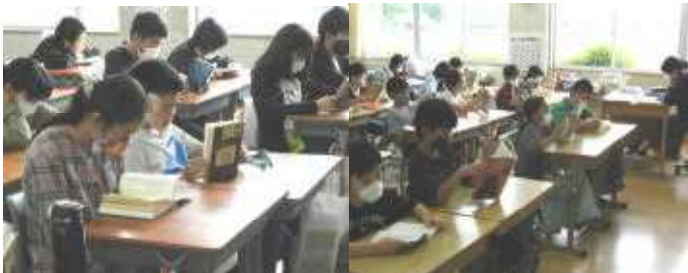
静かに読書する6年教室