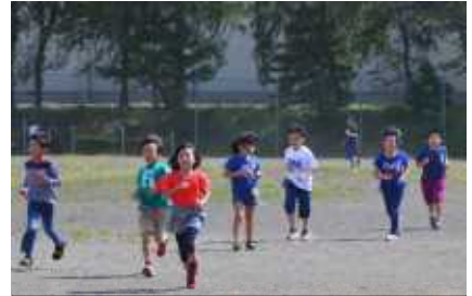
グラウンドを走る2年生

保健日より「やっほー」でもお知らせしましたが、子どもたちは10月2日(水)実施予定の校内マラソン大会に向けて体育の時間や休み時間を使って走り込みをしています。マラソン大会は、低学年が約600m、中学年が約800m、高学年が約1000mの校舎の回りを走るコースで行われます。子どもたちの意欲を喚起するため、左下の