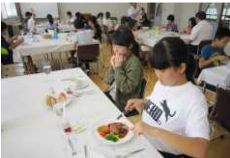
ナイフとフォークを上手に使うって…

25日(水)6年生が田沢湖給食センターで洋食マナー教室を実施しました。栄養教諭の先生からナプキンの使い方、スープの飲み方、ナイフとフォークの使い方などを教えてもらい、