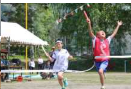
左: 1年生のダンスに合わせて... 上: 5・6年リレー歓喜の瞬間 右: 総合優勝の白組代表児童