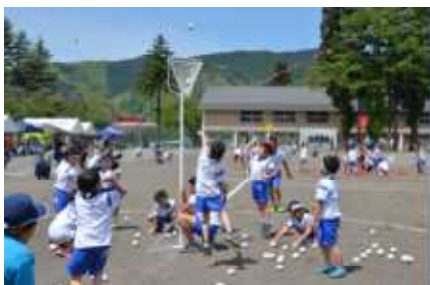
左: 1年生による玉入れ 右: 6年生親子による趣向走