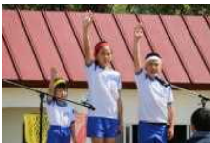
左: 各組代表による選手宣誓 下: 3年生以上による綱引き 右: 2・3年生によるデカパンリレー