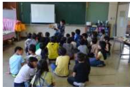
Fさんの読み聞かせを 真剣に聞く2年生

なお、こまくさ4号でもお知らせしましたが、読み聞かせのボランティアに興味のある方がおりましたら学校にでも結構ですのでご連絡ください。