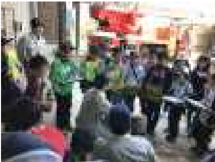
署員の方の説明に耳を傾ける4年生

また同日、4年生は社会科の学習で消防署の見学に行きました。消防署の方々から、普段どんな仕事をしているのかや仕事で大変なことなどを教えてもらいました。また、4年生からは「どのくらいの時間、訓練しているのですか」などの質問が出ました。この後、火災を防ぐ施設や人々の働きについて学びを深めることとなります。今後も各学年とも、地域に出かけての学習が続きます。ご理解とご協力、どうかよろしくお願いいたします。