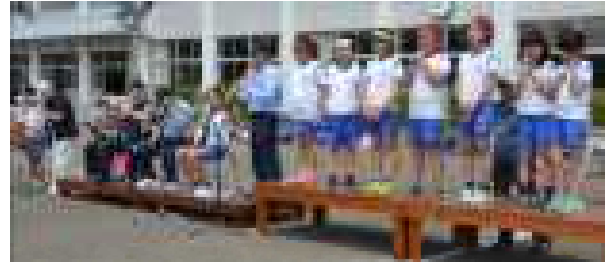
生保内節を演奏してくれる方々と唄ってくれる児童

今年の生保内節は、最初から保護者の方と一緒に踊っていただくことにしました。多くの方々に参加していただき、運動会を盛り上げてほしいと思います。よろしくお願いいたします。