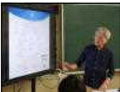
↑【熱く語る、講師さん】

明日実施される「白浜クリーンアップ」の様子については、次号でお伝えする予定です。今回は、先週月曜日に行った「事前学習会」の時の写真をご覧ください。