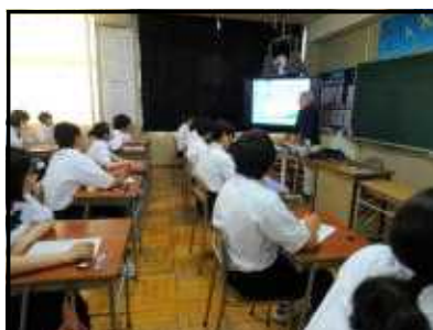
↑【みんな、真剣に聞いています】