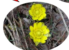
一足早く フクジュソウが 咲きました