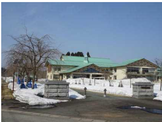
雪どけを待つグリーンパーク

さて、新学期まで残すところ一週間となりました。新学期を迎えるにあたり、持ち物に名前を付ける、学年の表示を直す、用具の整理整頓をする、新しい学年へのイメージを持つなど、もの、心、体の準備は整っているでしょうか。何事もはじめが肝心です。早め早めの準備を心がけ、新しい学年への期待感ややる気を高め、順調なスタートにつなげてほしいと思います。今日からの一日一日を、『新学期への助走』と考え、有意義な一週間にできるよう願っています。