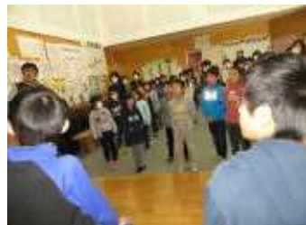
6年生に歌声を贈る1～5年生