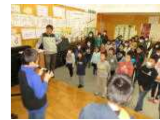
途中でリコーダーの演奏も 入ります