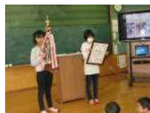
みんなの前で大会での がんばりを報告