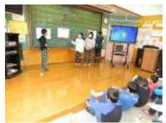
5年生が振り返りをし、 みんなで共有します