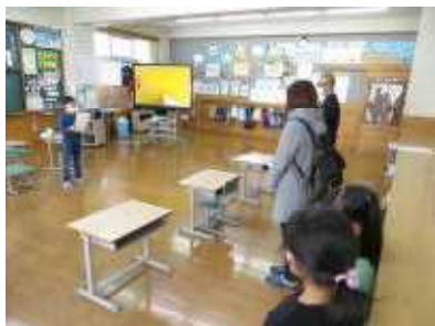
これまでの活動をふり返って

保護者の皆様にも、授業を通して子どもたちのこの1年の成長ぶりがきっと伝わったのではないのでしょうか。お忙しい中、そして雪が降りしきる中での学習参観、本当にありがとうございました。