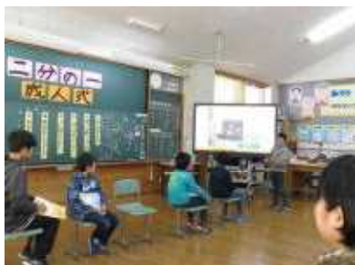
これまでの10年とこれからの10年を