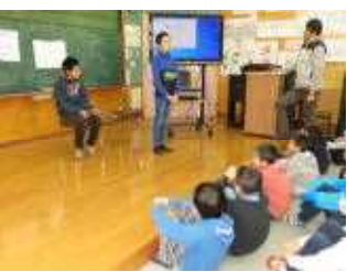
下級生に歌の感想を 伝えます