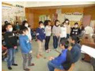
6年生に歌声を贈る5年生