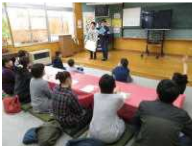
今まで ありがとうの会