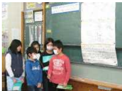
お母さんのおなかの中での成長