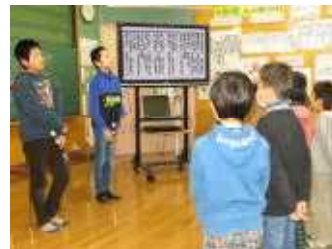
全校で歌を響かせあう 中川っ子たち