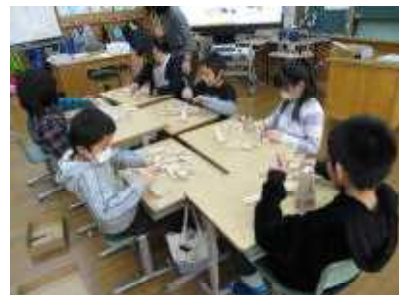
切った角材を思い思いの形に