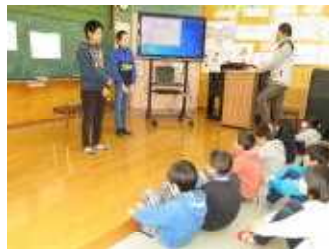
1～5年生に 歌をとどける6年生