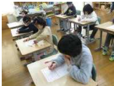
20個の漢字を3つのグループに