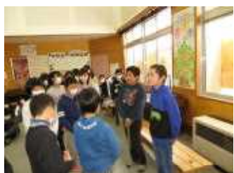
5年生に歌の感想を 伝えます