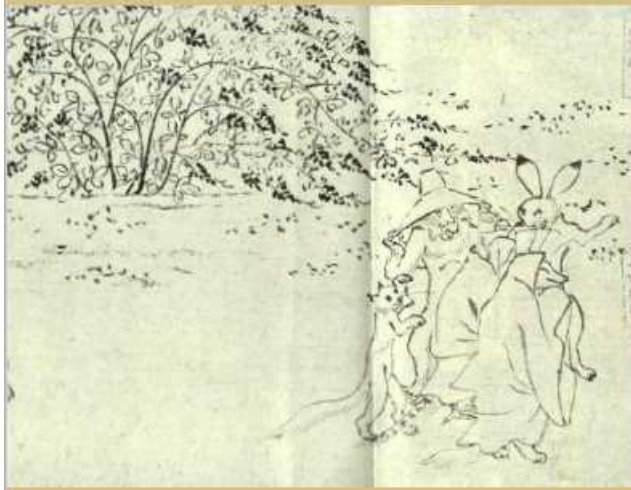
甲巻第3グループ 16紙