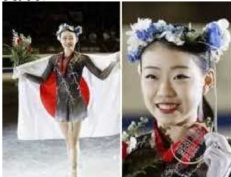
グランプリファイナルで金メダルをとった紀平梨花選手