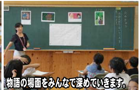
物語の場面をみんなで深めていきます。