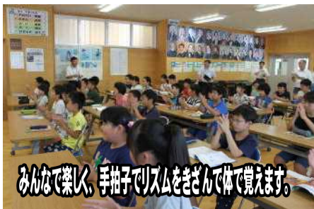
みんなで楽しく、手抽子リズムをきざんで体で覚えます。