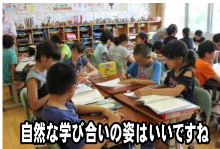
自然な学び合いの姿はいいですね