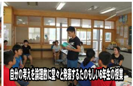
自分の考えを論理的に堂々と発表するたのしい6年生の授業