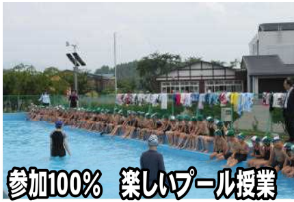
参加100% 楽しいプール授業