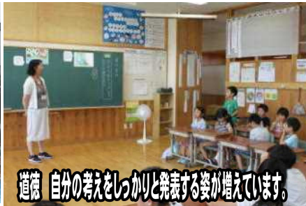
道徳 自分の考えをしっかりと発表する姿が増えています。