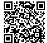
桜っ子日記QRコード

( https://www.city.semboku.akita.jp/sc_kakusyo/diary.html )にほぼ毎日掲載しています。写真・様子はそちらに詳しく載せていますので、ぜひご覧ください。そのため、学校報では連絡等の記事が多くなっています。