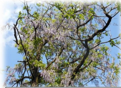
藤の写真は古城山で撮影

にずれを覚えるところですが、古城山の頂上にも美しい藤の房が下がっているのですが、先日、子どもたちとの会話の中で古城山