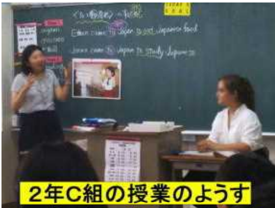
2年C組の授業のようす

昨日は、英語の授業での交流の他、壮行式も生徒といっしょに参加し、日本の学校行事を興味津々の様子で見っていました。今日も、2年生の英語の授業に参加してもらっていますが、16歳という近い年代ということもあり、教室でのやりとりは一層活気づいていました。