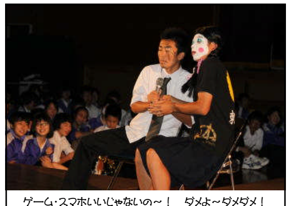
ゲーム・スマホいじらないの～！ ダメよ～ダメダメ！