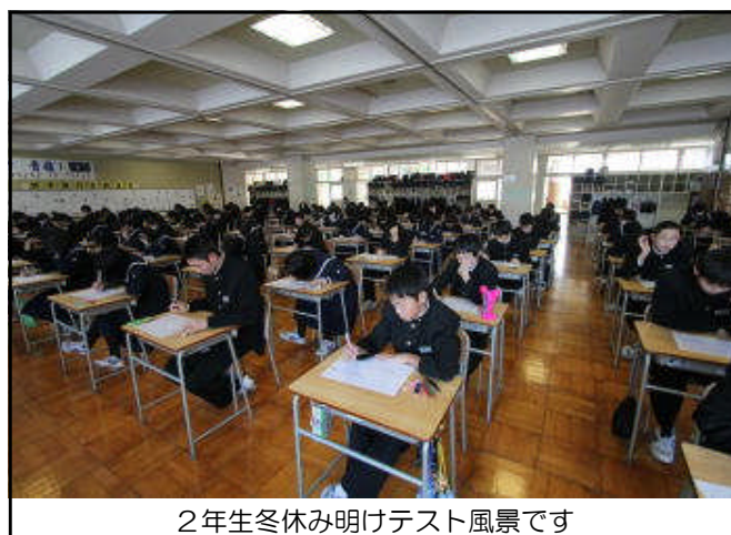
2年生冬休み明けテスト風景です