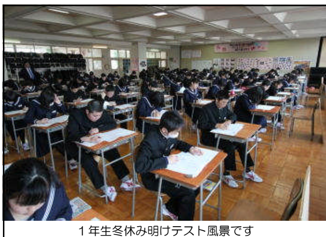
1年生冬休み明けテスト風景です

1・2年生は修了式までの授業日は45日、3年生は卒業式まで37日です。今、一番優先して頑張らなければならないことは何でしょうか？（と、書きながら、写真はテスト風景です）