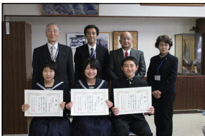
人権擁護の皆様がお出でになり、表彰いただきました

角中生には、「情報モラル」「人権を大切にする気持ち」を持ち続けてほしいと思います。