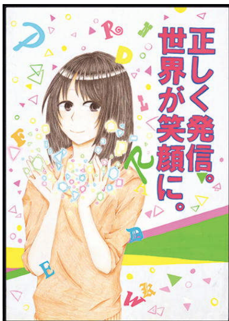
「情報モラル」入賞作品です