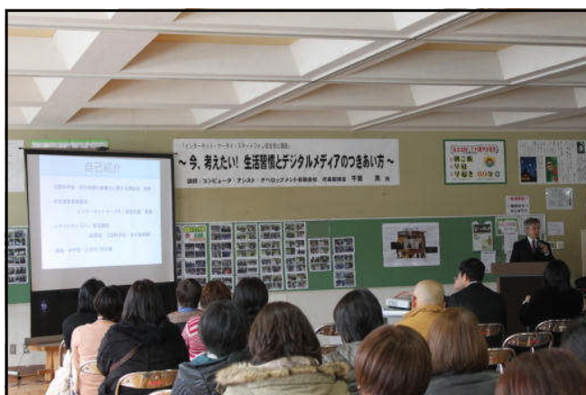
先週17日、PTAで情報モラルの講演会をしました

学校では、ケータイ、スマホ等は、中学校生活には必要ないと考えています 学校へのケータイ、スマホ等の持ち込みは禁止です