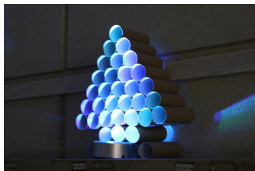
角中ホームページでもどうぞ。年明け更新予定です