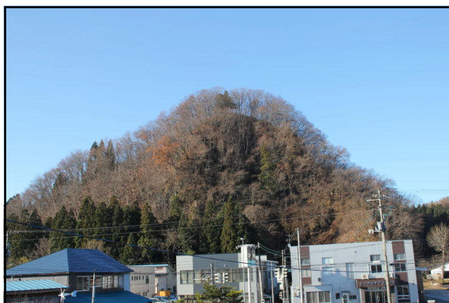
角中西側：落葉した小倉山（先週撮影）