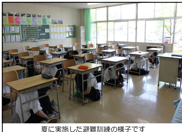
夏に実施した避難訓練の様子です

いつ起きるかわからないのが地震です。必ずしも学校、家庭にいる時に起きるとは限りません。最終的には、いつも言っていますが「自分の命は自分で守る」という意識が大切だと思います。