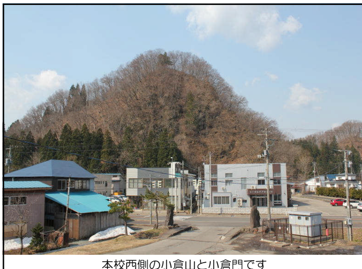
本校西側の小倉山と小倉門です

適宜、学校・生徒の様子をお知らせしますので、学校報「小倉山通信」のご愛読よろしくお願ひします。