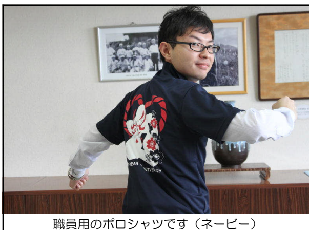
職員用のポロシャツです(ネービー)

本校職員も、自己負担でネービー色のポロシャツを購入し着用します。後程、保護者の皆様にも購入案内をしたいと思ひますので、ご希望の方はお申し込みください。