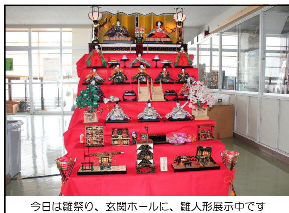
今日は雛祭り、玄関ホールに、雛人形展示中です