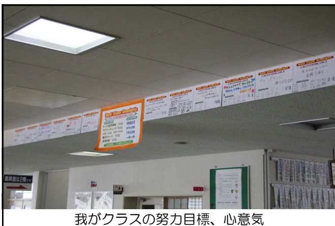
我がクラスの努力目標、心意気

生徒玄関内に、各クラスの「我がクラスの努力目標、心意気」が掲示され、キャンペーンを盛り上げています。