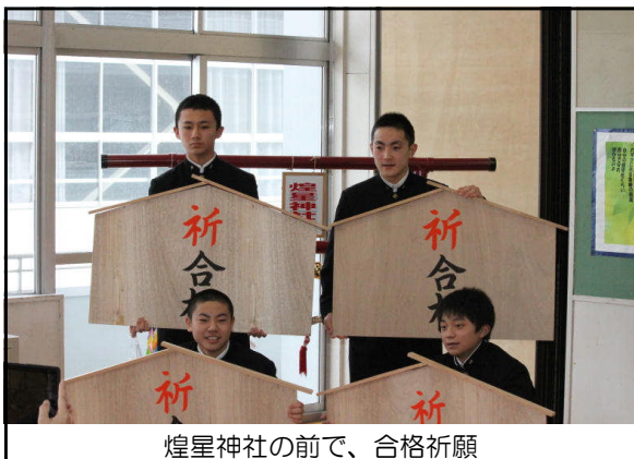
煌皇神社の前で、合格祈願

先週25日(火)朝、生徒会による受検に向けての激励集会が行われ、3年生の各学級に合格祈願の大きな札が贈られました。いよいよ受検間近です。