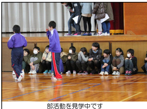
部活動を見学中です

体験入学で来校した6年生を見ていますと、角中生が、中学校生活の中で確実に成長してきていることを感じさせられ、嬉しい気持ちになりました。