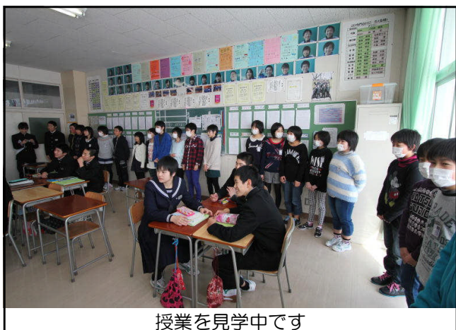
授業を見学中です