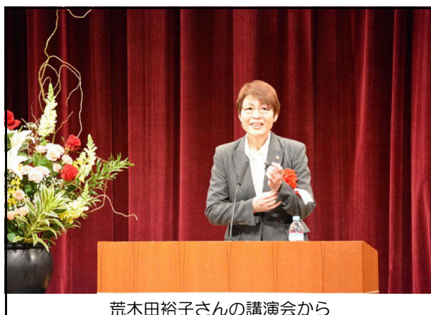
荒木田裕子さんの講演会から

【荒木田裕子さん：秋田県仙北市出身】 モントリオールオリンピック金メダル（バレーボール）