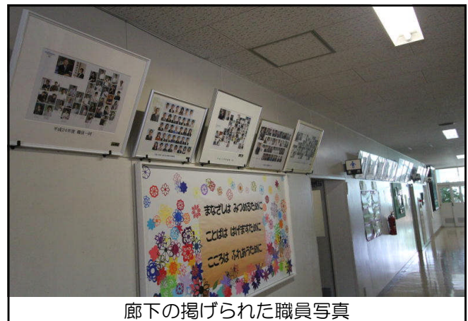
廊下の掲げられた職員写真

他校にお邪魔すると、校長室や廊下などで歴代の校長先生の写真を見ることがあり、お世話になった方もおり大変懐かしい気持ちになります。