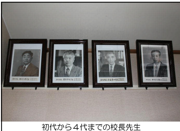
初代から4代までの校長先生