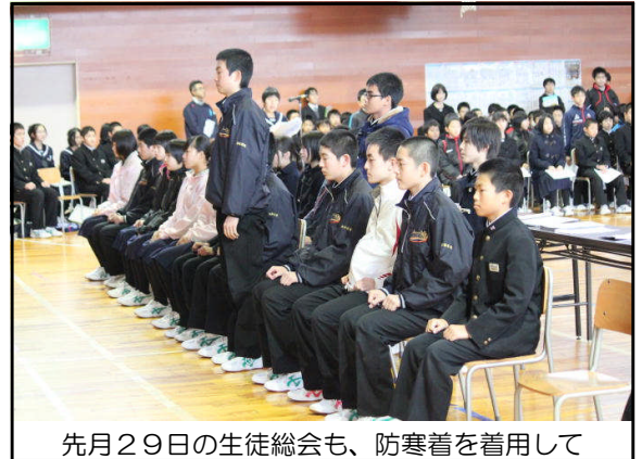
先月29日の生徒総会も、防寒着を着用して

これからやってくる厳冬期はどうしても灯油の使用量が多くなります。その時に備えて、今の時期は、次のような節約対応をしております。(12月9日現在です)