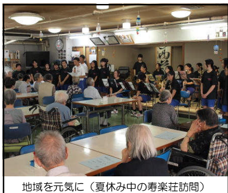
地域を元気に（夏休み中の寿楽荘訪問）

15日(日)、新人戦(野球)開催等の判断をするため、6時30分までに落合球場に着くように車を走らせていました。