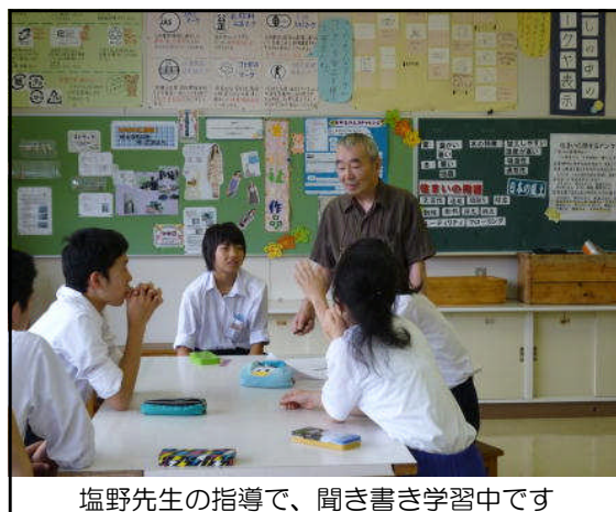
塩野先生の指導で、聞き書き学習中です

これからも、地域のために何ができるかを常に問い続けながら、教育活動をしていきたいと思えます。