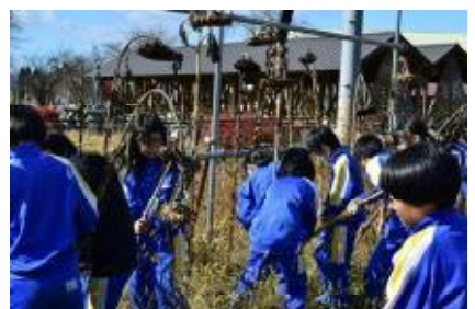
ジャンボひまわりは5年生が

全校で花の片付けに取り組んで来年の準備ができました。この後も、地域内の機関や施設へ花を届けたり、来春に向けてチューリップの球根を植えたりと、花の盛りを過ぎても活動は続きます。