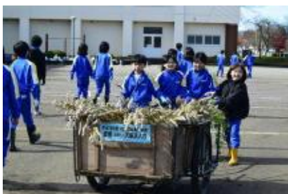
枯れた花を運んでいます