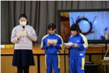
リースの作り方を説明