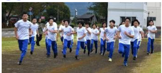
6年生のラストチャレンジ!!