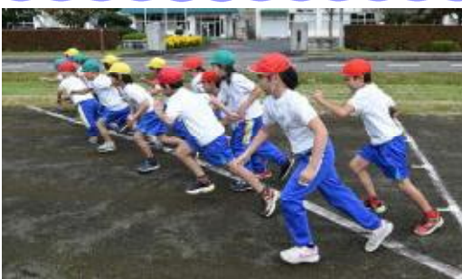
スタート!! 1年生が初めての挑戦