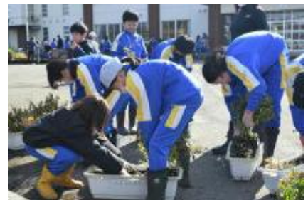
プランターの片付け