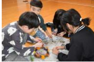
わかあゆ班で制作