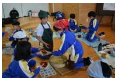
②みんなに汁をよそって

マラソンはほとんどの子どもが自己ベストを記録しました。豚汁は5・6年生ががんばって作りました。食べる際は わかあゆ班 ごとに、高学年が班のメンバーによそってくれ、あちこちで完食になっていました。