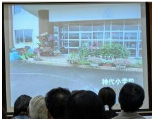
エントランスフラワーが注目されました