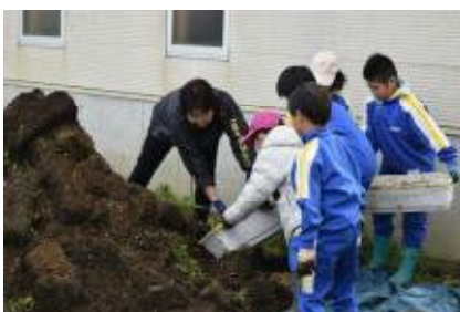
プランターの土を片付けています