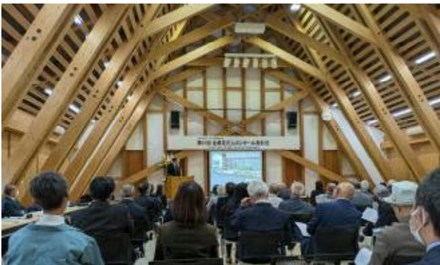
会場:秋田市遊学舎