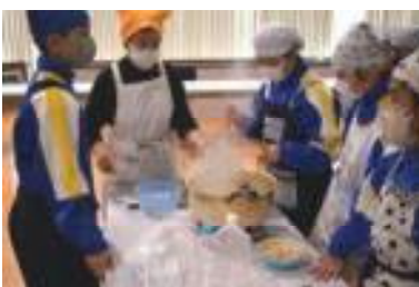
①地域の方といっしょに