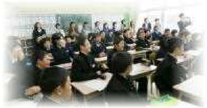
＝1年生の学級活動の様子＝