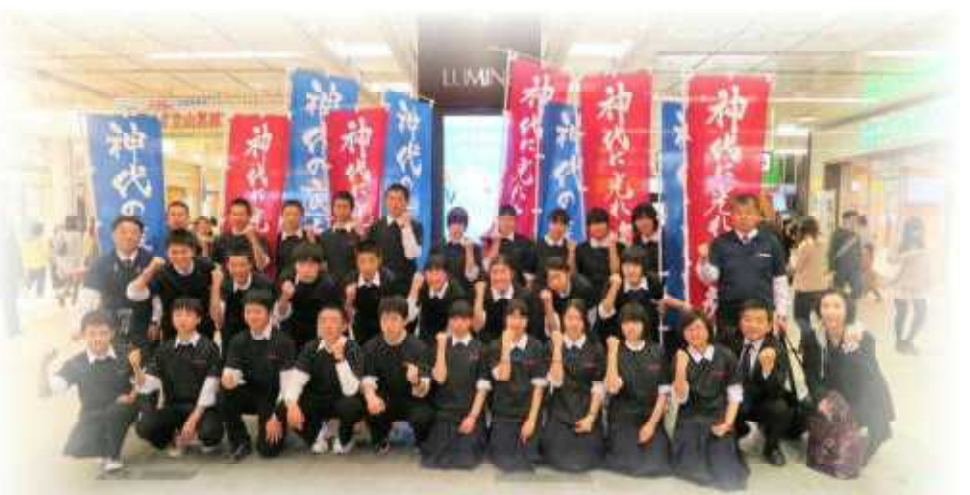
JR大宮駅での「仙北市のPR活動」を終えて 平成27年4月11日

浅草寺は土曜日とあって外国人を含む大勢の観光客で参拝も買い物も大変でしたが、グローバル化が進む世界の中の日本を実感することができ、とてもよい研修をすることができました。